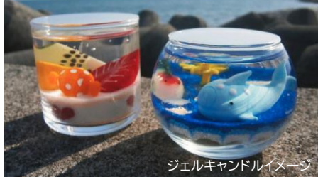
ジェルキャンドルイメージ