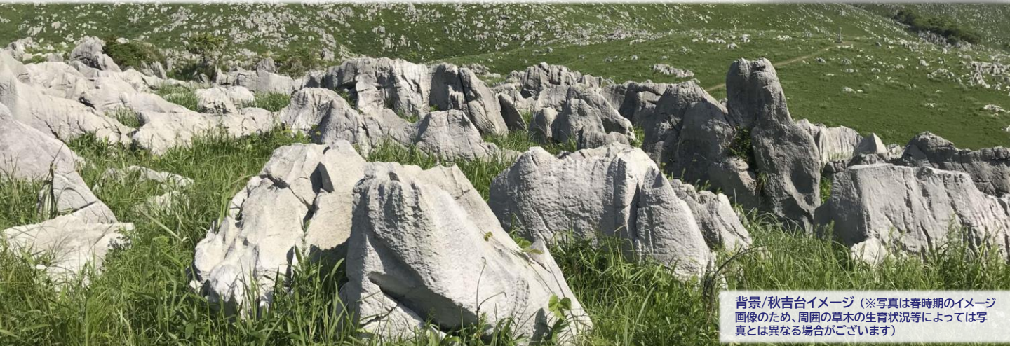
背景/秋吉台イメージ (※写真は春時期のイメージ画像のため、周囲の草木の生育状況等によっては写真とは異なる場合がございます)

ユネスコ世界ジオパークに認定された、美祿市『秋吉台・秋芳洞』を体感! さらに『山口きらら博記念公園』でのカヌーやSUP体験に加え、隣接する『きらら浜自然観察公園』での泥干潟観察など、豊かな自然の中でさまざまな体験を楽しむ夏休み限定ツアーです。