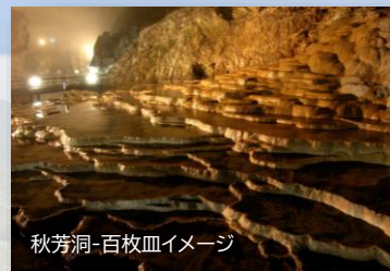
秋芳洞-百枚皿イメージ

ユネスコ世界ジオパークに認定された、美祿市『秋吉台・秋芳洞』を体感! さらに『山口きらら博記念公園』でのカヌーやSUP体験に加え、隣接する『きらら浜自然観察公園』での泥干潟観察など、豊かな自然の中でさまざまな体験を楽しむ夏休み限定ツアーです。