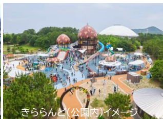
きららんど(公園内)イメージ

★2日目の選べるフリータイムで【A】コースを選択された方対象 【A：山口きらら博記念公園(公園内で自由/約5時間)】 【B：出発までフリータイム(宿周辺など自由観光)】