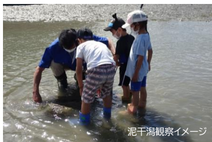
泥干潟観察イメージ

公園の泥干潟での生き物観察や自然物を使った工作体験などを通じて、山口県の生態系や自然の魅力について学ぼう！